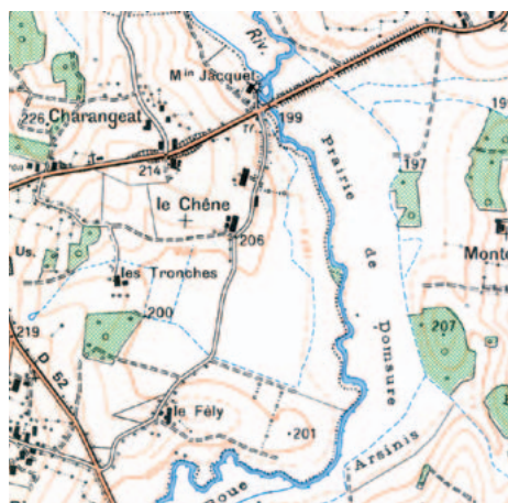
La carte IGN au 1:25 000, constamment remise à jour mais qui n'a rien d'exhaustif, identifie comme cours d'eau les tracés bleus, continus ou intermittents. Toutefois, cette présomption peut être infirmée ou confirmée par des constatations in situ.

L'entretien est nécessaire et obligatoire. Mais des opérations d'entretien mal adaptées peuvent entraîner des dommages difficilement réversibles pour le milieu aquatique et les propriétés riveraines. Par exemple, elle peuvent occasionner un recalibrage du cours d'eau, augmentant la vitesse des écoulements et aggravant les crues en aval, et causer des dégradations du milieu aquatique. Elles relèvent alors de l'aménagement.